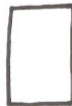
TRONC n° 1

Les patrons ne contiennent pas les marges de coutures